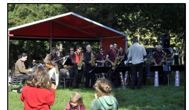
Huit formations au programme 2011

Afin de promouvoir la pratique amateur et séduire de nouveaux publics, le Festival a présenté avec l'Addim de l'Ain, Ain Pro Jazz, le Conservatoire de Bourg-en-Bresse et l'école de musique d'Ambrérie, huit jeunes formations depuis le début du Festival. Il s'agit de Dim Dam Domb, Flaga da Swing, Vou'v'tia Vénou, No Logic, Big Band Junior, Los Don Diegos, Le Big Band et l'Ensemble de Ouïvres.