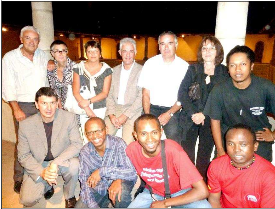
Partenaires et artistes ensemble à l'issue de la soirée du Club d'entreprises au Festival 2011.

Autant de témoignages recueillis sur place et qui prouvent s'il en était besoin l'importance que revêt aux yeux des entreprises de la région de soutenir une manifestation culturelle comme celle du Festival