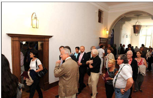
Inauguration de l'Aile sud rénovée

> L'Abbaye d'Ambronay rattachée à la Règle de saint Benoît a été fondée au début du IXe siècle par Bernard. Elle jouit d'une totale souveraineté au XIe siècle, ne dépendant que de Rome. Son rayonnement s'étend sur un territoire important comprenant 44 paroisses, 21 prieurés et 9 doyennés. En 1282, l'abbé Jean de la Beaume choisit de se mettre sous protection savoyarde. Au fil du temps et avec l'arrivée des abbés commendataires, les moines délaissent les principes de la vie en