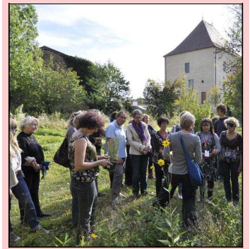
Une visite sensorielle

Ancré dans la tradition prestigieuse et reconnue de son Festival de musique ancienne, le Centre culturel de rencontre déploie une palette d'activités tournée autour de la musique ancienne et du spectacle vivant, du thème de labellisation « musique et sacré » et des territoires qu'il embrasse. Labellisé en 2003, le Centre culturel d'Ambronay identifie l'émergence artistique, forme les talents de demain, donne des espaces de répétition aux créateurs, provoque des rencontres fructueuses entre artistes d'horizons différents, entre scientifiques et résidents, et finalement entre ses publics. Toute l'année, le site de l'Abbaye vit au rythme des actions de sensibilisation aux différents arts - musique, photographie, théâtre, danse, conte, arts visuels... Mettant en avant des axes anthropologiques, sensoriels, artistiques en plus de l'historique, ses visites originales touchent un public nombreux. Le Centre culturel de rencontre d'Ambronay est aussi un acteur structurant du territoire en prise avec la vie économique de l'Ain et de Rhône-Alpes. Il fédère désormais autour de lui un noyau d'entreprises citoyennes qui, à travers un mécénat, inscrivent leur développement et partenariat dans une logique durable.